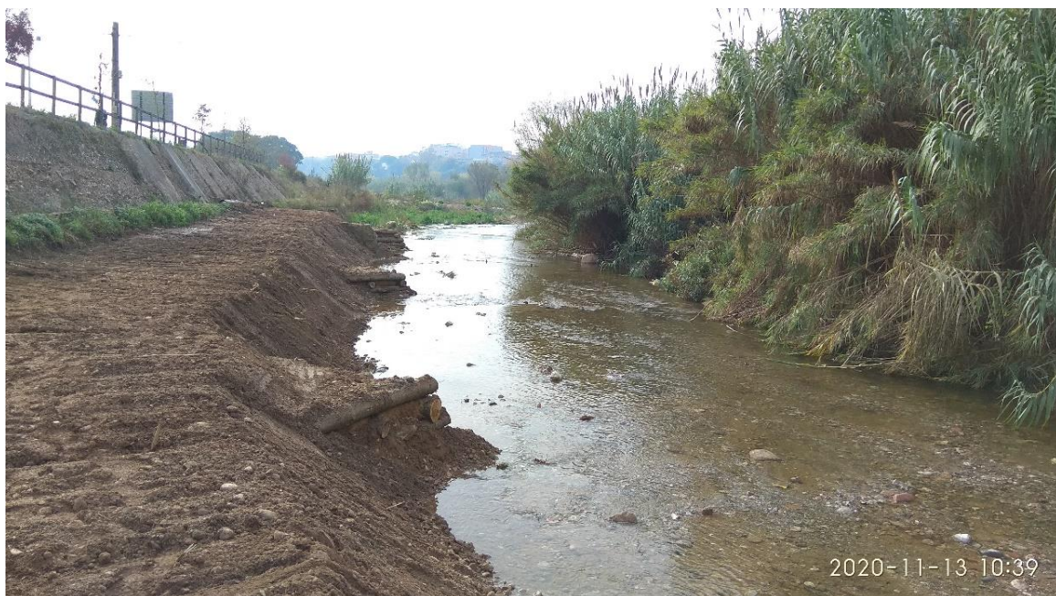
Figura 4. Lot 2 de la Fase 2 del Projecte de recuperació. Aspecte general de la llera restaurada i de les tres construccions de protecció.