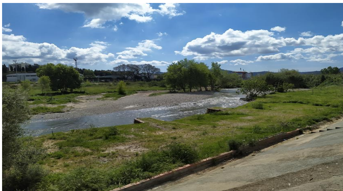
Figura 3. Aspecte del tram del riu Ripoll finalitzat. Al centre de la imatge es poden observar els deflectors.