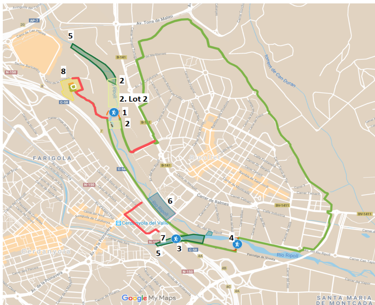
Figura 1. Plànol general del projecte. La línia verda remarca l'anella verda constituïda pel carril apte per a vehicles no motoritzats i zona de passeig per a vianants que rodeja el municipi ampliant-la en alguns punts. Aquesta anella parteix de la vora del riu i a partir d'ella es proposa la connexió amb les àrees de ribera i els espais lliures vinculats al sistema fluvial i el seu paper com a corredor biològic. A banda de l'anella verda s'indiquen les actuacions per recuperar les lleres dels rius Ripoll i Sec, les àrees de ribera i els espais lliures vinculats al sistema fluvial i el seu paper com a corredor biològic. Els números indiquen les principals actuacions (no coincideixen amb el número d'actuació de la MEMÒRIA, per a més informació, vegeu taula 1): 1, 3 i 4 guals AMB. 2 Projecte de recuperació ambiental. 5 Extracció de canya ACA (rius Ripoll i Sec) . 6 projecte "entre ponts". 7 Parc Fluvial Massot. 8 horta municipal Molí d'en Xec.