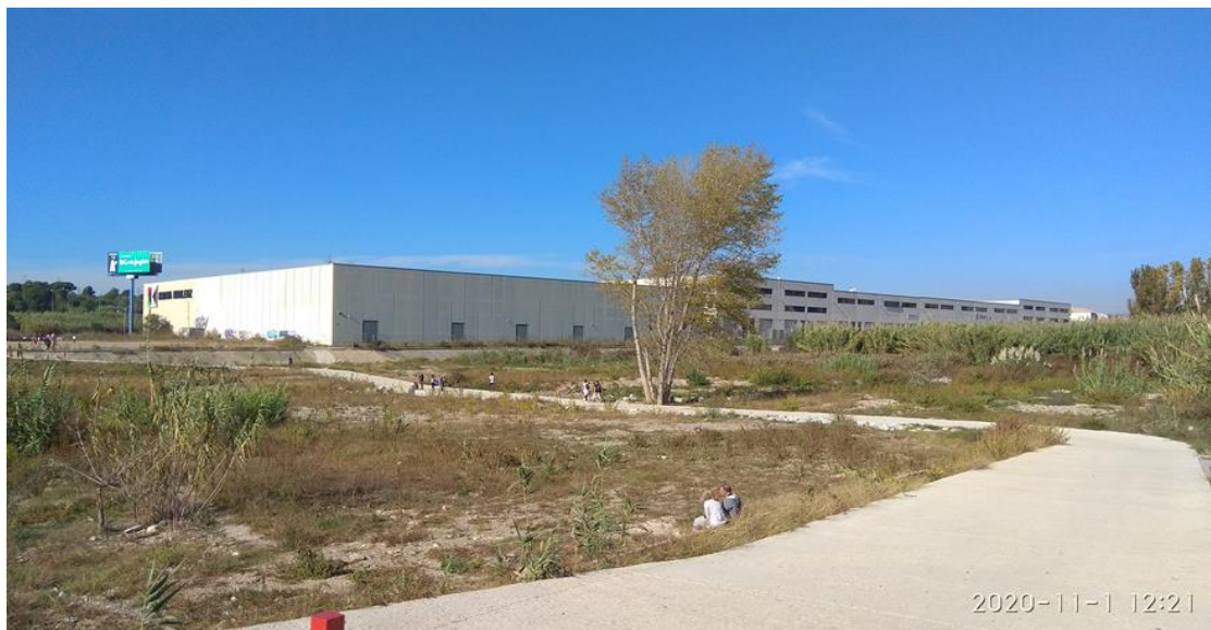
Figura 2. Vista general del gual inundable de Molí d'en Xec.