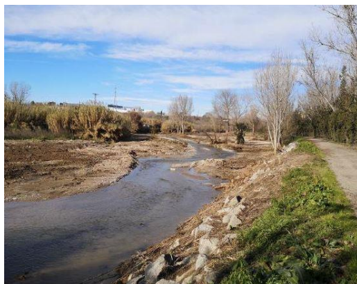
Figura 5. Aspecte de les actuacions dirigides a l'extracció de canya. Esquerra, riu Sec, dreta, riu Ripoll.