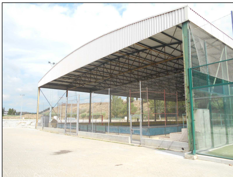
Vista 2 – Façana sud-oest

Projecte per a l'execució de dues façanes verdes a la pista-grades al Patronat Municipal d'Esports. Carrer Magallanes, nº 22-26 – 08291- Ripollet -