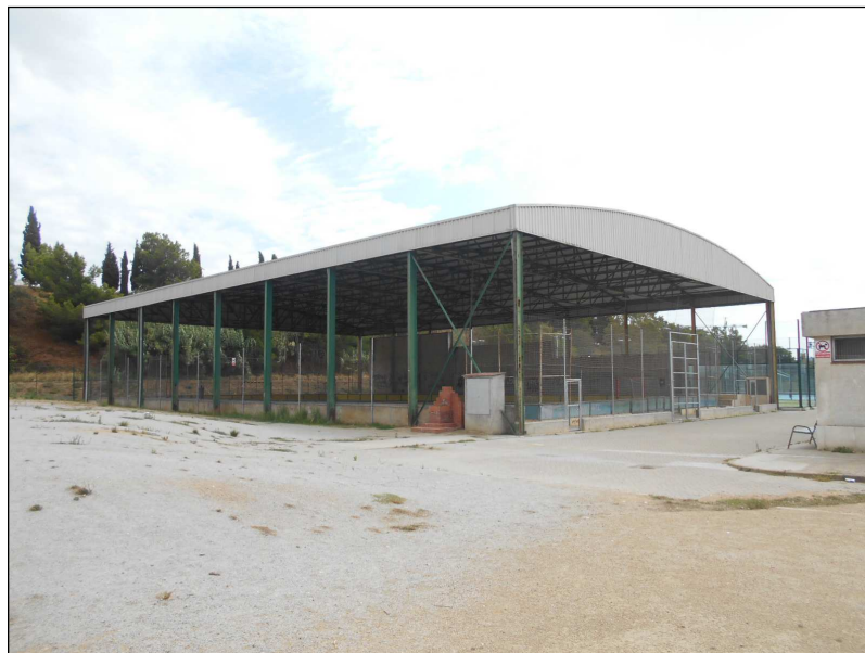
Vista 1 - Façana nord-oest -

Projecte per a l'execució de dues façanes verdes a la pista-grades al Patronat Municipal d'Esports. Carrer Magallanes, nº 22-26 – 08291- Ripollet -